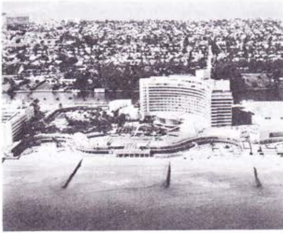
Fontainebleau Hotel, Miami Beach, Convention Headquarters

les moments-clé suivants réveillèrent certainement quelques souvenirs: des flots de voitures, de taxis, de break familiaux et de limousines d'aéroport défilaient sur les routes d'accès du Fontainebleau, de l'Eden Roc et d'autres hôtels et d'où descendaient des files de participants à la Convention tout excités venant de chaque état des Etats-Unis et province du Canada ainsi que d'Allemagne, Australie, Brésil, Colombie, Ecosse, Espagne, Equateur, Finlande, France, Grenade, Guatemala, Honduras, Irlande, Japon, Mexique, Nouvelle-Zélande, Norvège, Pérou, Puerto-Rico, San Salvador, Suède, Suisse, Thailand, Uruguay, Union Sud-Africaine.