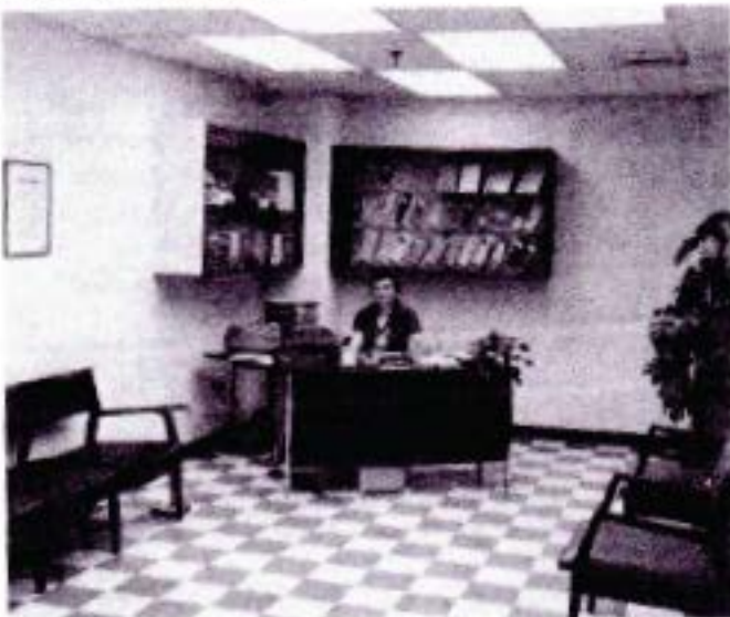
Chambre à Reception

Nous aimons de telles lettres, mais d'avantage, nous avons aimé accueillir les 784 visiteurs AA qui nous sont venus l'an passé de l'Amérique du Nord et de 15 autres contrées.