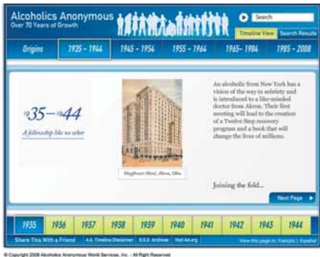
Début du tableau chronologique.