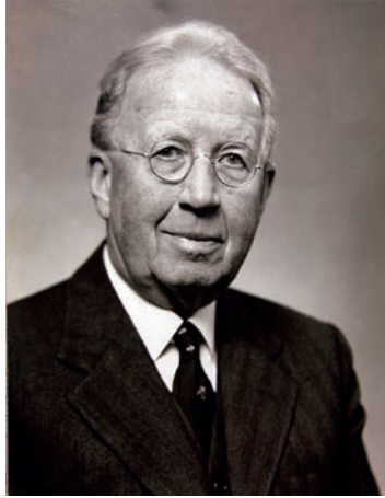
Dr Harry Emerson Fosdick

Le Gros Livre, Les Alcooliques anonymes , a été l'objet de nombreux sobriquets depuis sa première parution en 1939 ;