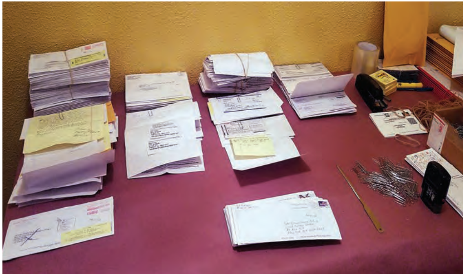
Salle de courrier temporaire installée par le superviseur du courrier/expédition d'AAWS dans son appartement dans le Bronx. Le courrier quotidien comprend les commandes de publications, les contributions, la correspondance de mise à jour et le courrier des détenus.