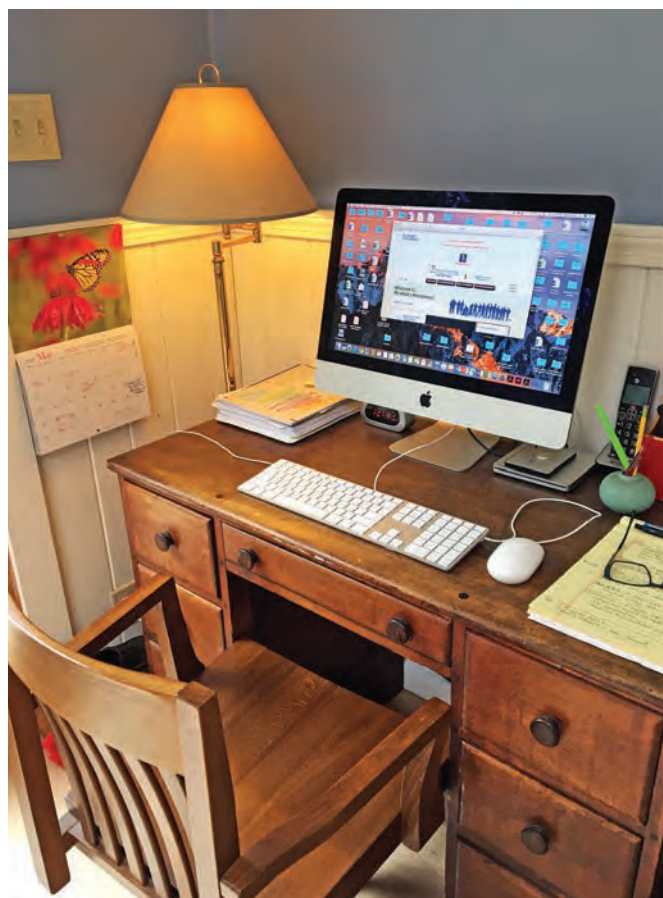
Le télétravail à domicile - l'installation d'un employé, y compris l'accès sécurisé au VPN (réseau privé virtuel) du bureau.

Le Service à la clientèle, explique David, est encore très occupé — les ventes ont baissé, mais le nombre de commandes pour de plus petites quantités a augmenté. Il est réconfortant de constater que les ventes du Gros Livre sont presque égales à ce qu'elles étaient avant la pandémie. Parmi les projets accomplis, il y a le « Catalogue 2020 des publications approuvées par la Conférence et autres documents des AA », avec de nouveaux prix simplifiés. Cent dix mille copies ont été imprimées qui seront insérées dans toutes les commandes qui vont partir de nos entrepôts. (Le Catalogue est aussi disponible en PDF sur aa.org .) Les nouveaux livres audio du Gros Livre et des Douze Étapes et Douze Traditions