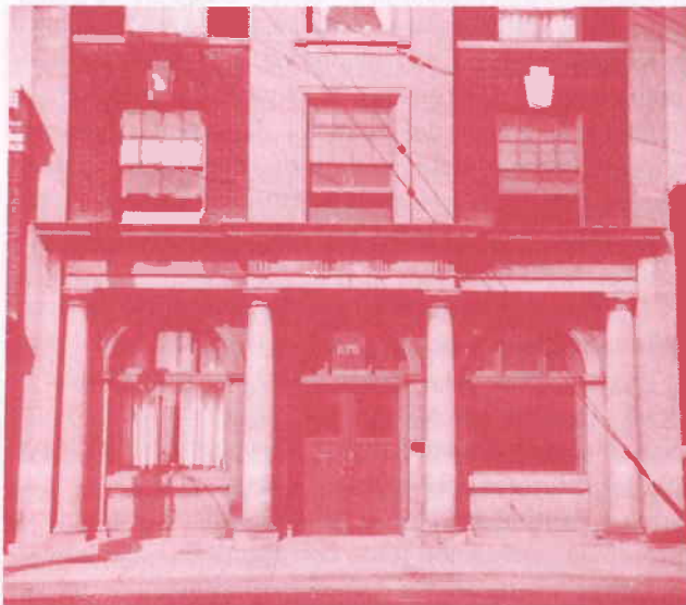
1170 Young Street, cercano a la tienda de licores y la estación de ferrocarril justo al otro lado de la calle, era el hogar del querido club de A.A. de Toronto desde 1944 hasta 1960.