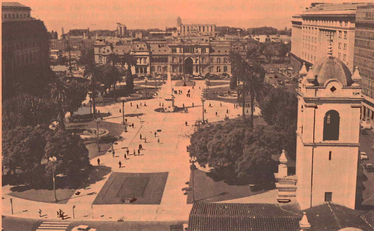
A los A.As. Ibero-Americanos les encantó haber visitado a Buenos Aires (la Plaza de Mayo).

"Fué una experiencia muy iluminativa", concluyó Phyllis, "y fueron muchos los ejemplos del dicho 'Entre más diferentes somos, más iguales somos', especialmente en A.A.!"