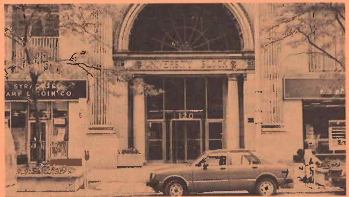
La oficina central de Syracuse está en el Cuarto No. 327 de este edificio.

"Nuestra oficina (perteneciente al Intergrupo del Area de Syracuse, Distritos 3 y 4) fué establecida alrededor de 1950, y desde entonces se han llevado a cabo muchos trasteos. En Marzo de 1980 nos trasladamos a nuestro local actual. Es un